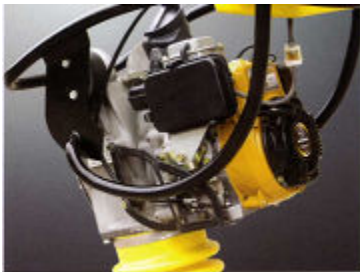
Marco protector especial para el motor