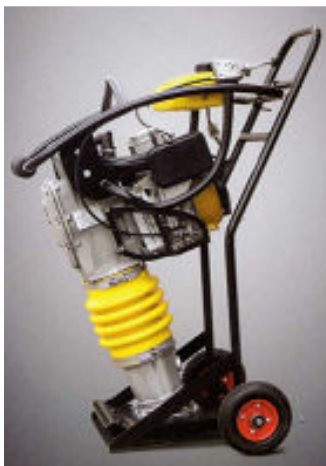
Carrito de traslado especialmente diseñado