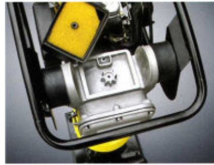
Sistema de filtro de aire interno